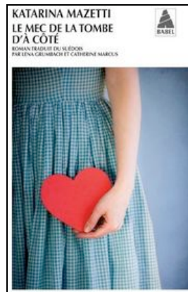
Le Mec de la tombe d'à côté Katarina Mazetti

Au CDI vous trouverez les livres, les bulletins de vote et le règlement.